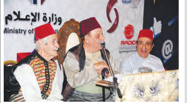
سائنا - الثورة

حكايات المرص صيغة جديدة لعرض تاريخ معرض دمشق الدولي منذ دورته الأولى حتى الدورة الـ 11 يقدمها ثلاثة فنانون سوريين مخضرمين عاصروا كل دوراته يقدمونها بشكل حي ومباشر أمام الجمهور بالزي التقليدي لشخصية الحكواتي التي كتب نصوصها الفنان أحمد خليفة وذلك في جناح وزارة الإعلام بالمرص.