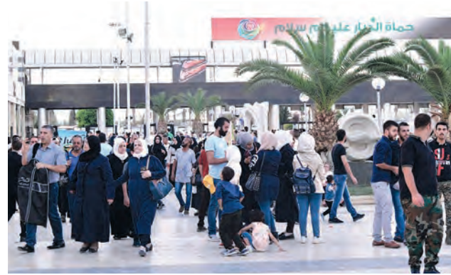
حضوراً مكثفاً للزوار لما تتضمنه من غنى وتنوع في معروضاتها، ووفر مركز