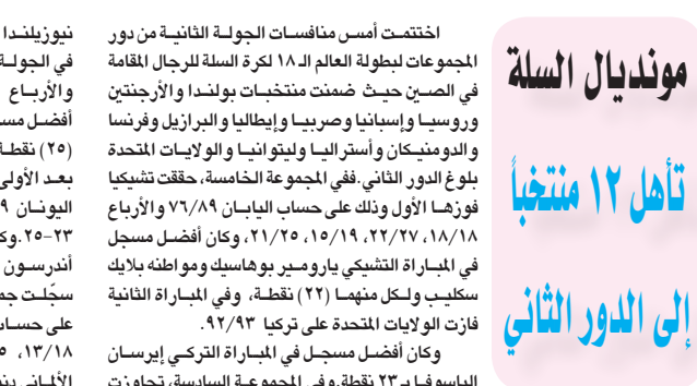
اختتمت أسس منافسات الجولة الثانية من دور المجموعات لبطولة العالم الـ ١٨ لكرة السلة للرجال القادمة في الصين حيث ضمنت منتخبات بولندا والأرجنتين وروسيا وإسبانيا وصربيا وإيطاليا والبرازيل وفرنسا واليونان وأستراليا وليتوانيا والولايات المتحدة وبلغ الدول التي ففي المجموعة الخامسة. حققت تشيكا فوزها الأول وذلك على حساب اليابان ٨٩/٧٩ والأربع ١٨/١٨، ١٥/١٩، ٢٢/٢٥، ١٥/١٩، ٢٥/٢٥، ١٩/٢٥، ١٨/١٨ في المباراة التي يشهدها باريمور بوماسيك ومواطنه لايك ستيب ولكل منهما (٢٢) نقطة. وفي المباراة الثانية فازت الولايات المتحدة على تركيا ٩٢/٩٢. وكان أفضل مسجل في المباراة الياباني نينس شوريد (٢٠) نقطة، وكانت جمهورية

متابعة رجب عبود: ودعت اليابانية ناومى أوساكا بطولة فلاشينغ ميديون الأميركية للنس خاتمة البطولات الأربع العظمى لعام ٢٠١٩ بخسارتها في دور الستة عشر أمام السويسرية بيليندا بينسيتش لتفقد لقبها وتخسر صدارة التصنيف العالمي. وخسرت المصنفة الأولى عالمياً المباراة ٥/٧، ٦/٤ في ساعة ٧٧ دقيقة. وتتخطى أوساكا عن صدارة تصنيف الالعاب المحترفات لآسترالية أشلي بارتي بطلة رولان غاروس والمصنفة ثانياً عالمياً حالياً والتي ودعت البطولة الأميركية من دور ال١٦ أيضاً بخسارتها أمام الصينية وانج كيكاينج. وستلعب بينسيتش في الدور ربع النهائي مع الكرواتية دونا فيكيتش التي فازت على الأثينية جوليا جورجيس من دور ال١٦. ولم يسبق لفيكيتش تخطي الدور الثالث في فلاشينغ ميديون والذي كانت بلغته عام ٢٠١٧. وتبقى أفضل نتيجة لها في الفرانك سلام من نهائي ويمبلدون ٢٠١٨ ورولان غاروس هذا العام. وتتفوق بينسيتش على فيكيتش بـ١٠٧ فوزين في ثلاث مواجهات جمعت بينهما حتى الآن ويعودان إلى عام ٢٠١٤. لكن الكرواتية فازت بالمباراة الأخيرة أمام السويسرية، صديقتها وشريكها الدائمة في