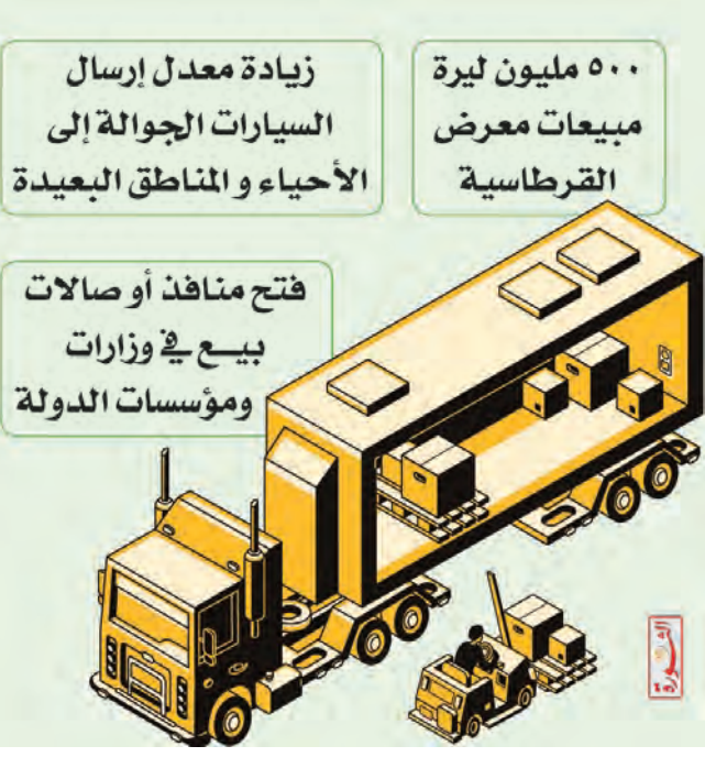
مطابقتها للمواصفات المطلوبة.

يذكر أنه سيتم على هامش الملتقى ورشات عمل وندوات متعلقة بالمصارف والضرائب والمالية معقدة القطاع الحكومي لتتليل العقبات والتوصل إلى حلول تسهم في دفع عجلة الاستثمار السياحي.