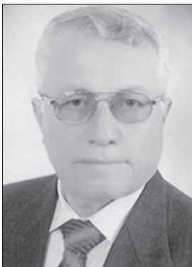
■ بقلم: د. فايز عن الدين

بخصوصها بينما لو قامت أميركا وأطلسيوها بتدمير أي منطقة من الأرض السورية لانسجم بالصحيح حول المدنيين والجانب الإنساني، ولا نجد أي رغبة بعقد اجتماع مجلس الأمن لكان المدنيين يوجدون فقط في الجبهات التي يخوضها الجيش وحلفاؤه ضد الإرهاب، ولا يوجد مدنيون في الأماكن التي تقرر أميركا الضرب فيها. ولكي لا يتعامل حلف العدوان الإرهابي على سورية مع وقائع الميدان، ولا يجعل منها إبطاً لتفاهات جديدة على طريق الحل السياسي نراه مصراً على العداة للدولة الشرعية السورية ولا يحترم إرادة شعبها فيها، ولا سيادتها على أرضها حين يقوم بإخلاء قواته إلى أرضها، وإقامة قواعد العسكرية حتى من سورية يخرج قرارات مجلس الأمن. نعلم لقد أصبح المجتمع الدولي يدرق حقائق كثيرة كانت الميديا الغربية تتجاهل إخفاها منها أن مساحة الشرعية للدولة السورية محدودة جدا وليس حولها شعب كما تدعي، ليتضح