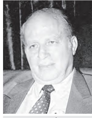
■ بقلم د. أحمد الحاج علي

حينما يبسط الزمن الأغبر معاملة ومعانيه على البشر، وحينما تتشكل هذه الإرادة من الشر الذي سرعان ما يجد مبادئه وتطبيقاته على الأمنيين والعندين في الأرض، وفي مثل هذا المناخ يبحث أصحاب النفوس الضعيفة عن ذرائع وحجج تؤهلهم عندهم للانطلاق وتمهيد السبل كلها لكي يحدث فيها الحريق، ويكون أول المنتجات الحرام في مناخ الشر والهيمنة هذا الإختراع الذي يتدرج ليصبح غريزة عند الأنظمة والدول كما في سلوك الأحزاب والتنظيمات، ومن ثم في انتشار المخترعات السموم لتصبح في حالات كثيرة ثقافة الفرد وغريزة الفرد ولربما سعادة هذا الفرد. ويتجلى هذا الوباء أكثر ما يكون في نهج الفبركات الفكرية والسياسية والاجتماعية التي يتقن المعتدون في إطلاقها، وقد عنونها بخبرة الاستعمار ومعطيات التكنولوجيا الحديثة المدمرة في الغرب، وتسلبوا بها عبر ثغرات الشعوب والدول المسكوتة بالضحايا والخلف واستغلال جهل الإنسان. وهذا نهج التكامل الكلي ما بين سادية المعتدي في إطلاق الفبركات والخدع والأكاذيب مع أطر ومحاور الشعوب