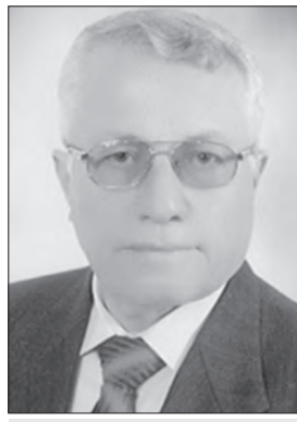
■ بقلم د. فايز عز الدين

العلاقات الدولية لتصبح أميركا هي السبب الوحيد لعدم تعتمها بالأخلاق اللازمة لقيادة النظام الدولي - أمام معضلة تغير العالم في مشهده: الاقتصادي، والعسكري، وأن منظومة القوة الأميركية لم تعد كافية لإجبار القوى الصاعدة على الرضوخ لإرادة أوهام اليانكي وللصهيانية الذين يديرهم إدارته في البناتاغون، والكونغرس، ولكي تستعيد أميركا المبادرة الدولية التي افتقدتها أشارت العديد من الحروب في الأقاليم المختلفة، ومنها في المنطقة العربية التي تمهأ أولاً باعتبارها الوكيل الحصري في تنفيذ الشرى الصهيوني على أرض العرب. وقد تلاحت عدة أحداث وحروب على أرضنا من لبنان إلى سورية، إلى غزة، وحين فشلت العوانات والحروب الصهيونية بالدعم الأميركي، ومنذ عام 2008م شرعت الأزمة المالية الدولية تقوض أحلام الجيوستراتيجيا العالمية الدولية، وشرع العالم يشهد التحرك السياسي نحو فرض صورة العالم المتعد الأقطاب في النظام الدولي، والوقوف بوجه خطاب القوة الصلبة الأميركية ما أجبر أوباما الرئيس الأميركي أن يستبدل السياسة الأميركية في ما سماه: القوة الناعمة التي سوف تحقق الأهداف الأبروصهيونية ذاتها لكن بعزيم من المرونة في العلاقات الدولية، ومع ذلك بقيت