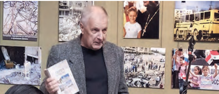
قاسية حملتها عاصفة من الأحقاد اللا إنسانية ليهما إذ أن شعبي البلدين كانا ضحية لفرق غيبي أسود يكفر الآخر في مكان ويقصي الآخر في مكان شان لدا جاء هذا المعرض ليكشف للزوار حقيقة ما جرى ويجري في سورية ودونباس منذ ٢٠١١

لأجيال القادمة البعد الغلامي لأفكار اللا إنسانية في إلغاء الأخر مضيفة أن هذا المعرض يؤكد في الوقت ذاته حقيقة أخرى تتجلى في قوة النضال الإنساني بوطنه وأرضه وفي استعدادة لبذل الغالي والنفيس في سبيل حمايتها.