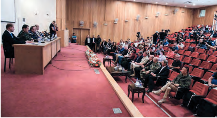
أحدية الجانب بهدف الضغط على الشعب السوري.