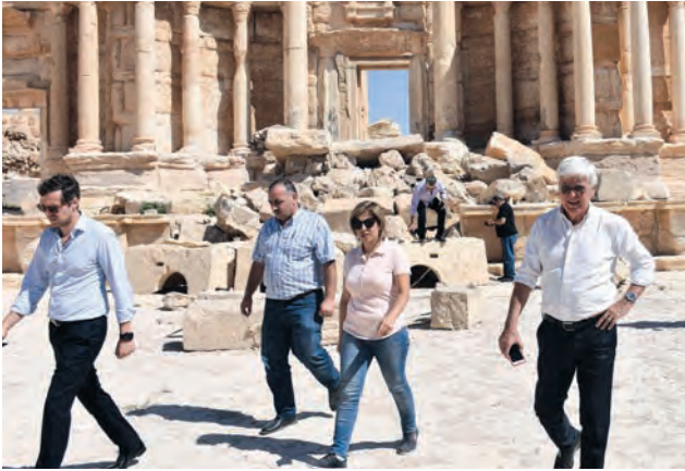
جانب من زيارة الوفد الإيطالي إلى تدمر

وأوروبا لكن وجود آثار مدينة تدمر في وسط الصحراء شيء مميز وجميل جدا، مبرعا عن أمه الكبير بالتعاون لتقديم شيء مفيد لهذه المدينة العجيوبة من جانبه عبر عضو البرلمان الإيطالي مانيو كريمبانجو عن استيائه وتأثره العميق تجاه ما فعله أعداء العلم والثقافة بتدمير صروح أثرية تارة بالعلم مشيراً إلى أن إيطاليا مستعدة للمساعدة في إعادة إعمار هذا التراث المولغ بالقدم والمجد لكل العالم.