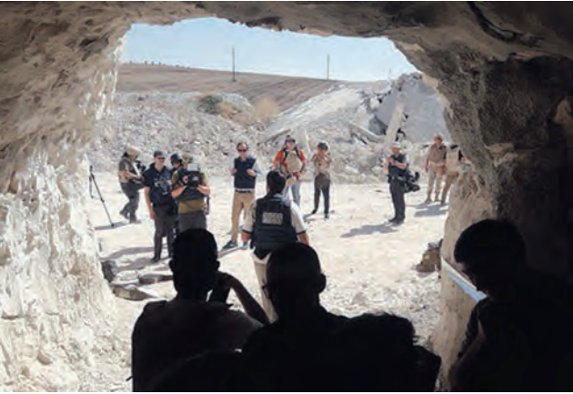
وسائل إعلام أجنبية توثق أنفاق إرهابي «النصرة»