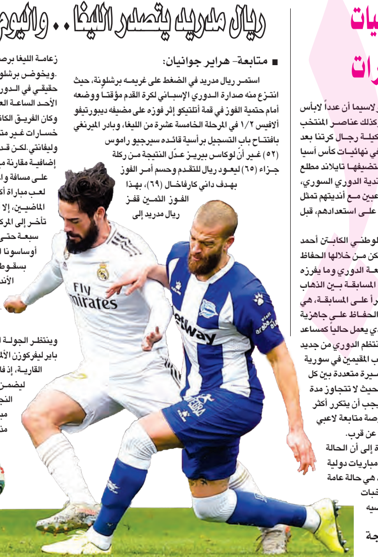
ريال مدريد يتصدر اللمنار.. واليهوم الترجيحية ال١٦٥ بين الشكر والمدريد وريال مدريد

استمر ريال مدريد في الضغط على غريمه برشلونة، حيث انتزع منه صدارة الدوري الإسباني لكرة القدم مؤقتاً ووضعه أمام حتمية الفوز في قمة أنتيكو إثر فوزه على ضيفه ديورتيغو الألبيس ١/٢ في المرحلة الخامسة عشرة من اللمنار، وبارد المريني بافتتاح باب التسجيل برأسية قائدته سيرجيو راموس (٥٢) غير أن لوكاس بيريز عدل النتيجة من ركلة جزاء (٦٥) ليعود ريال للقدم وحسم أمر الفوز بهدف داني كارفاخال (٦٩). بهذا ريال مدريد إلى زعامة اللمنار برصيد ٣١ نقطة بفارق ٣ نقاط عن غريمه برشلونة ويخوض برشلونة حامل اللقب في آخر موسمين أول اختبار حقيقي في الدوري، عندما يحل ضيفاً على أنتيكو مدريد اليوم الأحد الساعة العاشرة ليلياً في ختام المرحلة الخامسة عشرة.