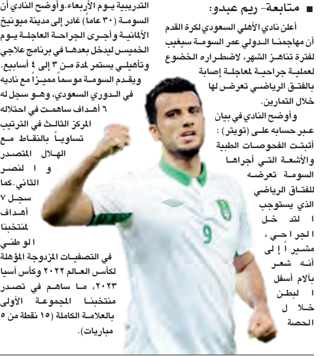
مباراة - ريم عبود: أعلن نادي الأهلي السعودي لكرة القدم أن مهاجمنا الدولي عمر السومة سيغيب لفترة تناهز الشهر لاضطراره الخضوع لعملية جراحية لمعالجة إصابة بالفتق الرياضي تعرض لها خلال التمارين.

وأوضح النادي في بيان عبر حسابه على (تويتر): أثبتت الفحوصات الطبية والأشعة التي أجراها السومة تعرضه للفتق الرياضي الذي يستوجب التدخل الجراحي، إلى مشير إلى أنه شعر بالآلام أسفل الوركين خلال الحصة.