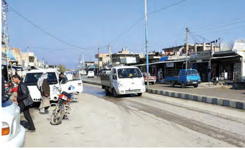
أهالي أبو راسين يعودون إلى حياتهم الطبيعية

تل تمر ودخلت قرية السوسة الغربية وصوامع جنوب العالية بريف الحسكة الشمالي الغربي وخلال الشهر الفائت تبثت وحدات الجيش نقاطها على محور بمند بنحو ٩٠ كم وذلك في إطار مهامها الوطنية لمواجهة العدوان التركي ومرتزقته وحماية الأهالي. إلى ذلك بدأت مظاهر الحياة العامة تعود تدريجياً في ناحية أبو راسين والقرى التابعة لها في ريف الحسكة الشمالي متوافقة مع عودة الحركة والنشاط التجاري إلى الأسواق مع حالة الاستقرار التي أرساها وجود الجيش العربي السوري في المنطقة.