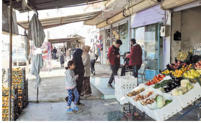
أهالي أبو راسين يعودون إلى حياتهم الطبيعية

من جديد إلى البلدة ويشهد مركزها حالياً عودة للنشاط التجاري من خلال استئناف الأسواق ممارسة نشاطها التجاري وتأمين متطلبات واحتياجات الأهالي. ويتابع الخيرو «إن غالبية أهالي الناحية هجروا مع بداية العدوان التركي على الأراضي السورية ودخلهم إلى أجزاء من ناحية أبو راسين ولكن دخول الجيش العربي السوري إلى المنطقة وتوسيع طوق الأمان والتحسينات التي أجراها كان له أثر واضح ومباشر في تشجيع الأهالي على