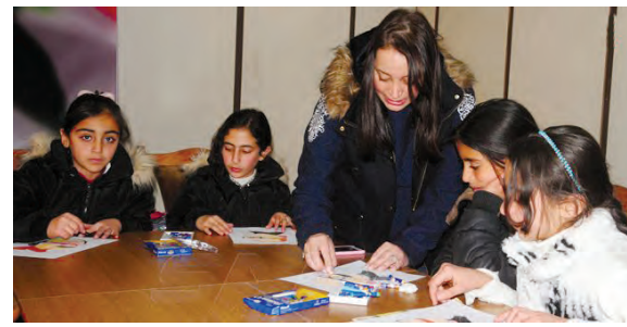
أغنى الكتب المدرسية برسوماته التي خصصها طوال خمسين عاماً لأدب الأطفال في الكتب والصحف والمجلات كان ضيف معرض كتاب الطفل في مكتبة الأسد الوطنية.

الفعالية التي أقامتها مديرية ثقافة الطفل استمع خلالها الأطفال لحكاية هذا الفنان كما قدمت لهم دفاتر الرسم والألوان ليجربوا الريشة واللون اللذين استمد منهما البحرة رسومه وإبداعاته.