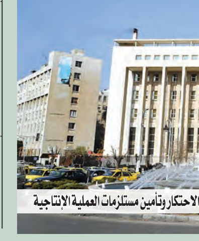
تمويل القائمة المستوردة لتنفيذ لتوصية اللجنة الاقتصادية

دعا لمخاطبته عبر موقعه وصفحته تلافياً للتأويلات والفبركات المركزي؛ مستثمرون بتمويل المواد الغذائية الأساسية