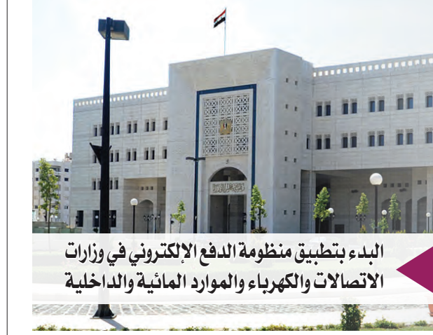
البداية بتطبيق منظومة الدفع الإلكتروني في وزارات الاتصالات والكهرباء والموارد المائية والداخلية

خمس رئيس مجلس الوزراء تمويل المشاريع الاستثمارية والتنمية الاقتصادية التابعة للجهات العامة عن طريق طرح «سندات» مشددة على أن هذا البريد يفضح الطبيعة المخادعة لتقرير المنظمة حول الهجوم المزعوم. والتعاون الدولي ووزارة المالية.