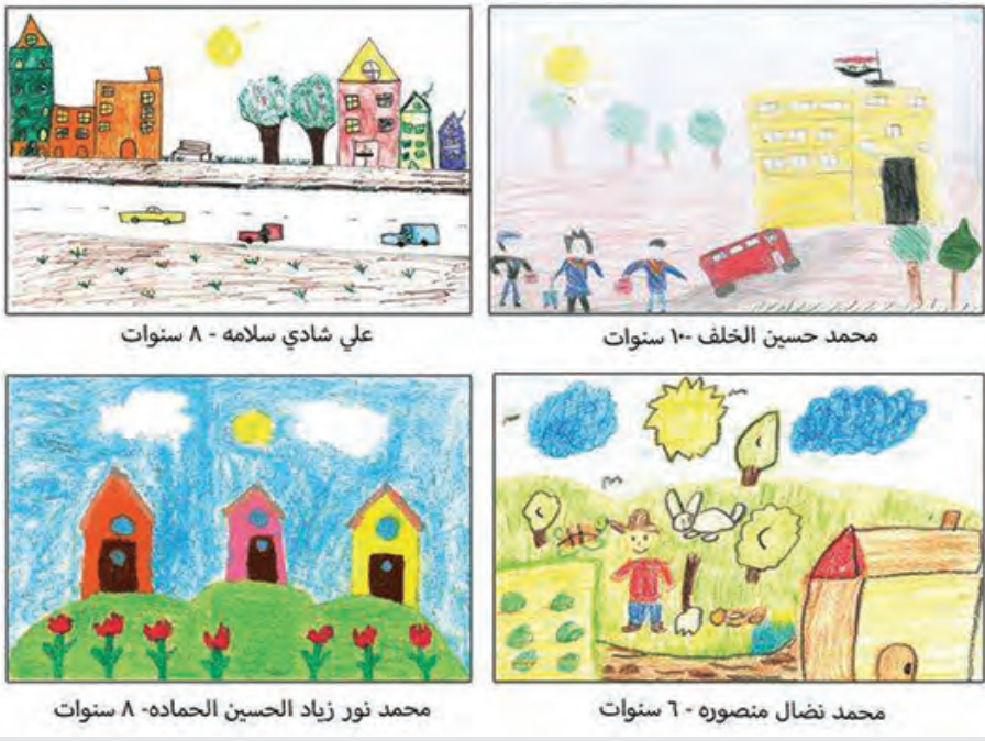
علي شادي سلامة - ٨ سنوات