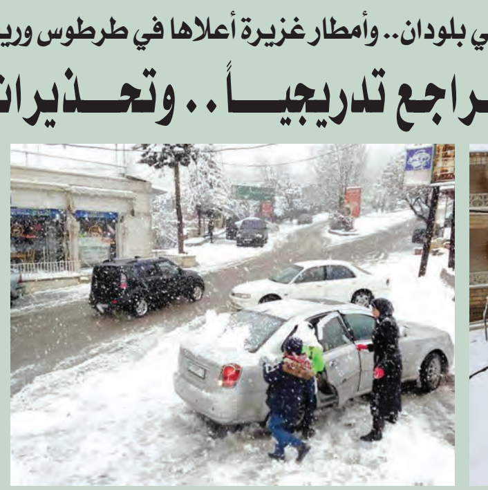
من ثلوج بلودان

عشرات الفعاليات التجارية تنضم لمبادرة «زكاتك.. خفض أسعارك» ٤ بمشاركة ١٣٥ شركة وطنية انطلاق «صنع في سورية» بدمشق ٥ تحتج «الشوكة» عن الصدور الأحد القادم بدلاً من يوم عطلة سابق