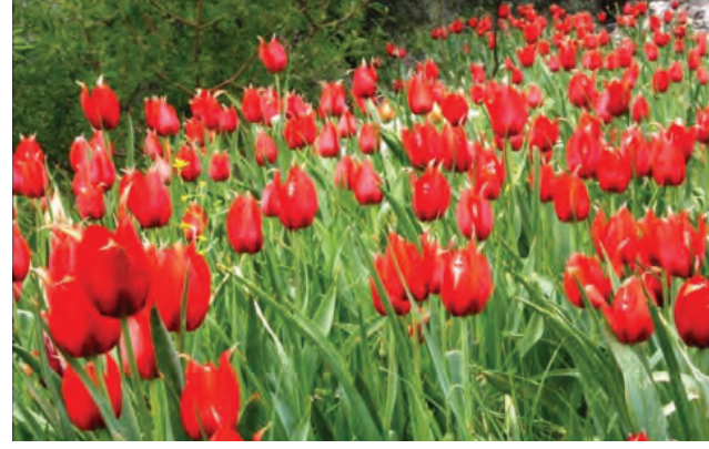
■ دمشق - الثورة:

يرتبط الشتاء عند الكثيرين بمواسم الحضبات والكسواء، وفواكه أخرى يزرعها الإنسان، وتغيب عنا حقيقة جماليات الأزهار الشتائية ولا سيما البرية منها التي تضيح بالحيوية والشذا العطر، ومنها البنفسج الذي ينتشر في مناطق كثيرة من سورية، أجمله البري الذي ينمو بين الصخور في البراري، وقد تم نقله إلى حدائق المنازل، ولن ننسى البنفسج الذي ينمو بين الصخور مع أول موجة دفاء تتخلل الشتاء، هانك عن لون آخر يرتبط به يسمى (البريهان) وهو ناصع البياض لكنه دون راحة كما البنفسج، يضاف إليها ما يسمى الجوحاج، وهو نمتة خريفية لكنها تستمر في فصل الشتاء، ومع نهاية الشتاء يبدأ موسم التوليب بألوانه الرائعة. أما الثمار البرية التي تدهشك فهي (الريحان) الآس كما يسمى، وثمار البلوط والسنديان التي هي نوع من الكسواء البرية، أما الأكثر جمالا فهو القلطب الشجر رائع الجمال، وشجرة القلطب مصدر مهم للغذاء للإنسان والطيور والعصافير لأن ثمارها تنضج في فصل الخريف وتستمر في إعطاء