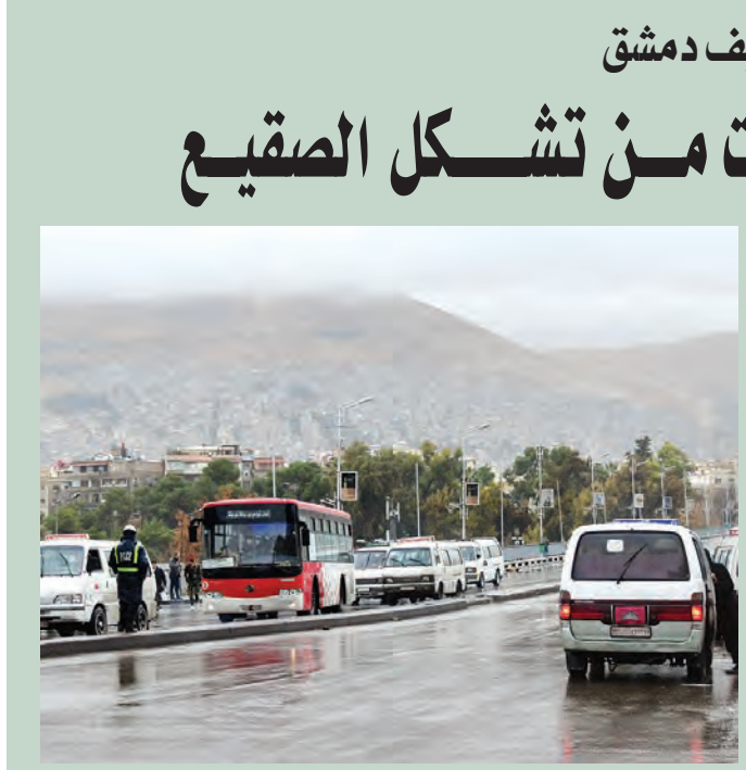
من أمطار دمشق