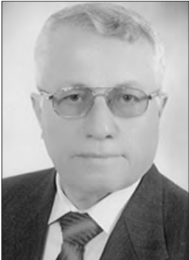
■ بقلم: د. فاضل عز الدين

الرمال على الكيان المحتل الغاصب بل أصبح حسابها موقوفاً على خاثة الأصدقاء إرضاءً لأميركا المنصهينة وتابعتها المطيعة المملكة البريطانية؛ نعم لقد ذاب الثلج، وبان الحرج عند العقلاء الوطنيين لكن عند العملاء المرتبطين ما تزال أميركا الملجأ ولذلك لم يتجرؤوا على إدانتها حين دخلت بقواتها إلى الأرض السورية بغطرسة القوة ومن خارج قراري: مجلس الأمن الدولي، أو الدولة الشرعية السورية. فالمرتبطون لا يجدون بأميركا عدواً محتلاً، ولا بإسرائيل عدواً مغتصباً بل يجدونها داعمين للثورة والإرهاب الذي يدعم ويدار من خارج الحدود الوطنية، ويعزل عن إرادة الجماهير يسمى عندهم ثورة حتى يغطوا الاحتلال الإمبريالي الأطلسي لأراضٍ من بلدنا، ولكي يستكثروا بواطن مؤمل عن نهب البترول السوري وخيرات الأرض والبشر المواطنين في بلدنا. ومع ذلك فهم أي الباعون أنفسهم أعداء أمتهم ما زالوا يجدون أميركا أنها المصمّم الوحيد للدستور المزعوم عبر تداول لجنة مناقشة الدستور في باشرت مع بلدنا، ووفقاً للقضاء المطلوب منا اليوم نحن السوريون أن نجتمع على حقيقة وطنية واحدة توحى لنا بأن بلدنا إذا ما ترك على حالة الاشتباك الدولي الحاصل عليه، واستمر وقوفنا الوطني يميل إلى حالة انتظار ما سيسفر عنه تقدم الميدان لجيشنا البطل وحلفائه، ولا سيما النصر المقرب في إلب و غرب حلب فهذه الحال لا يعكس الوقعة الوطنية المعروفة