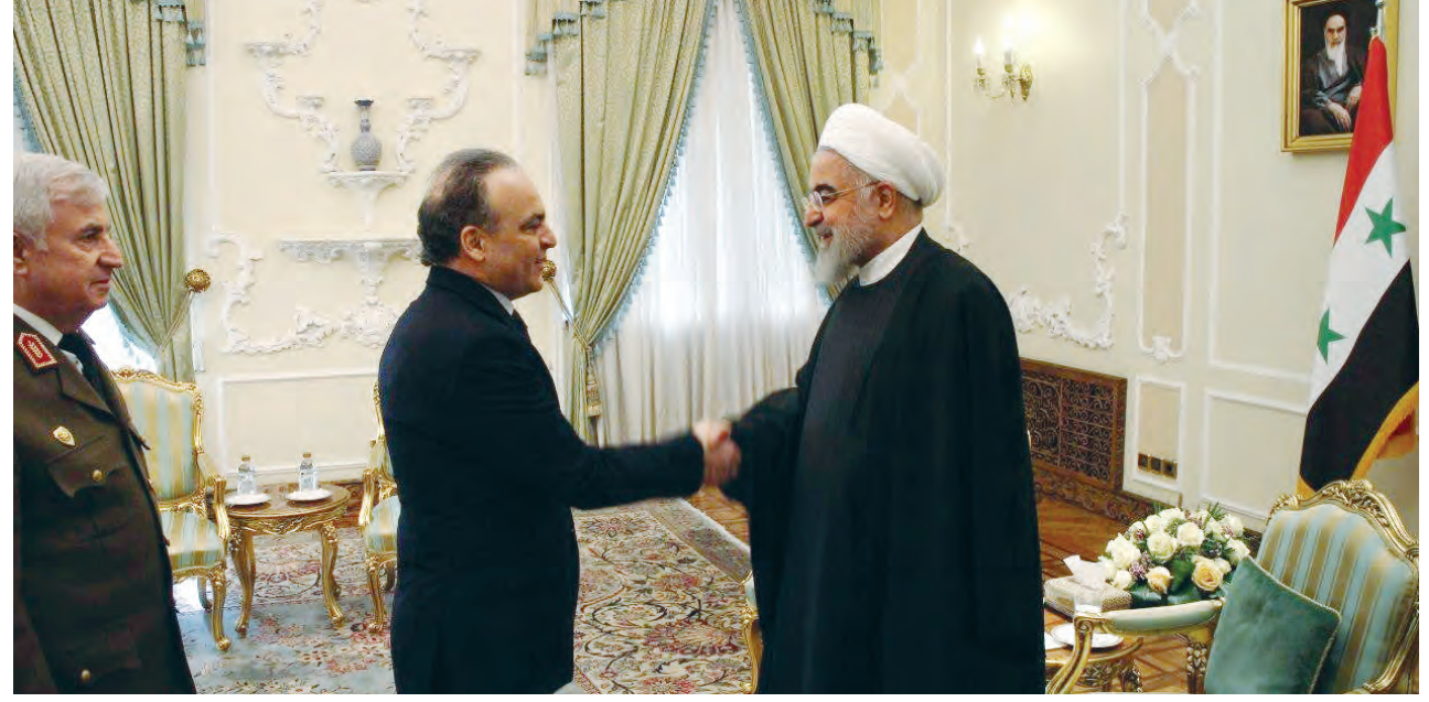
روحاني: العلاقات السورية الإيرانية ستبقى متجدرة

عشرات المدنيين يخرجون من مناطق انتشار الإرهابيين بريفي حلب وإدلب .. والتنظيمات الإرهابية تستهدف ممر الحاضر بالقذائف