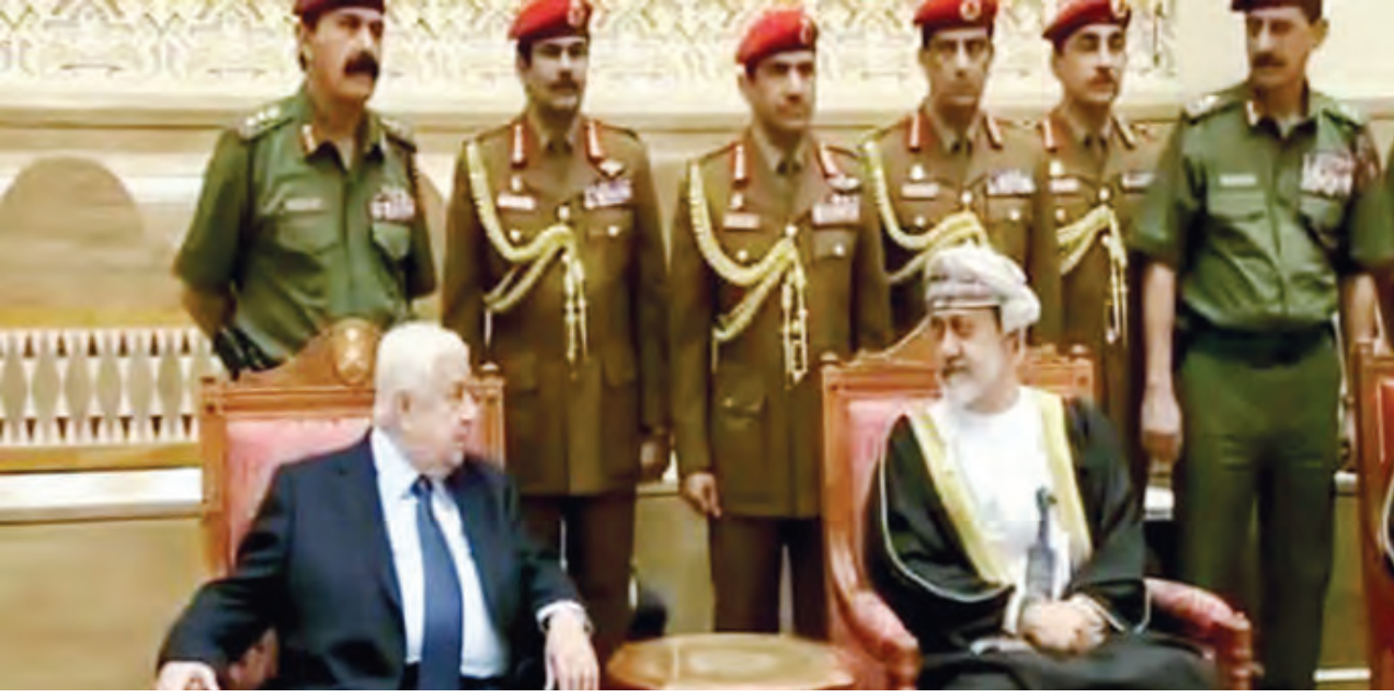
السلطان هيثم بن طارق: الاستمرار في تعزيز العلاقات الثنائية

المهندس خميس يقدم واجب التعزية للرئيس روحاني باستشهاد سليمان؛ مواصلة اجتثاث الإرهاب وتحرير المنطقة من رجسه