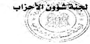
لجنة شؤون الأحزاب