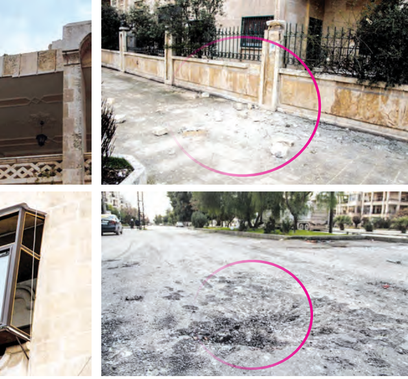
من آثار الاعتداءات الإرهابية على حلب

افتتحها الجهات المعنية في أبو الظهور والهيبط والحاضر بريفي ادب وحلب وأمنتها وحدات الجيش العربي السوري العاملة في تلك المناطق. وذكر مراسل سانا في حماة وحلب أنه بعد ٩ أيام على افتتاح مرمرات أبو الظهور والهيبط بريفي ادب