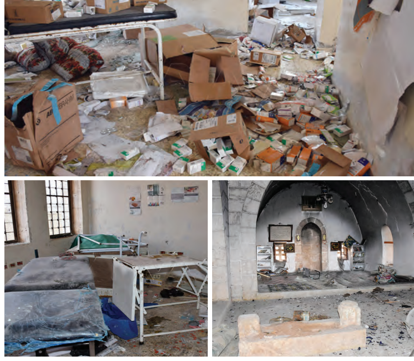
من آثار ما خلفه الإرهابيون في بلدات تلمس والدير الغربي والدير الشرقي بريف إدلب

انتشار الإرهابيين ونقلهم إلى منازلهم بعد إعادة الأمن والأمان إلى قرى التي حررها الجيش العربي السوري. ولقت المراسل إلى أن الجهات المعنية وفرت في المرات الإنسانية عيادات متنقلة ونقاط طبية لتقديم خدمات صحية إسعافية ومساعدات إغاثية وغذائية ريثما تتم إعادة الأهالي الواصلين بشكل فوري إلى مناطقهم عبر حالات جهزتها لهذه الغاية. وأشار مراسلو سانا إلى أن إرهابيي تنظيم جبهة النصرة واصلوا منع الأهالي من التوجه إلى المرات الإنسانية وقطعوا الطرقات أمام العديد من السيارات التي تقل المدنيين من الخروج مستخدمين أشيع أنواع التهديد ونشر الإشاعات لتخويفهم وبث الرعب في نفوسهم بغية اختناهم دروعاً بشرية واستغلالهم لأغراض المشوبهة. وأكد فرح دخول الجيش بلدات تلمس والدير الغربي والدير الشرقي بريف إدلب الجنوبي الشرقي لغفضت الإرهاب تم توثيق ما خلفه الإرهابيون في تلك البلدات. وكشفت وكالة سانا التي جالت في تلك البلدات