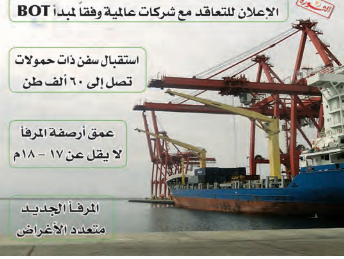
الاجل ان تتعاقد مع شركات عالمية وفقاً لمبدأ BOT استقبال سفن ذات حمولات تصل إلى ٦٠ ألف طن عمق أرصفة المرفأ لا يقل عن ١٧ - ١٨ م المرفأ الجديد متعدد الأغراض

المتمضعة تصديق عقد بالتراضي المبرم بين هيئة التخطيط الإقليمي والشركة العامة للدراسات الهندسية لإجناز دراسة للمخطط الإقليمي الساحلي مدته ٣١٥ يوماً، والذي سيتم من خلاله تحديد موقع المرفأ الجديد، وإعلان عنه للتعاقد مع شركات عالمية لتنفيذه وفقاً لمبدأ BOT.