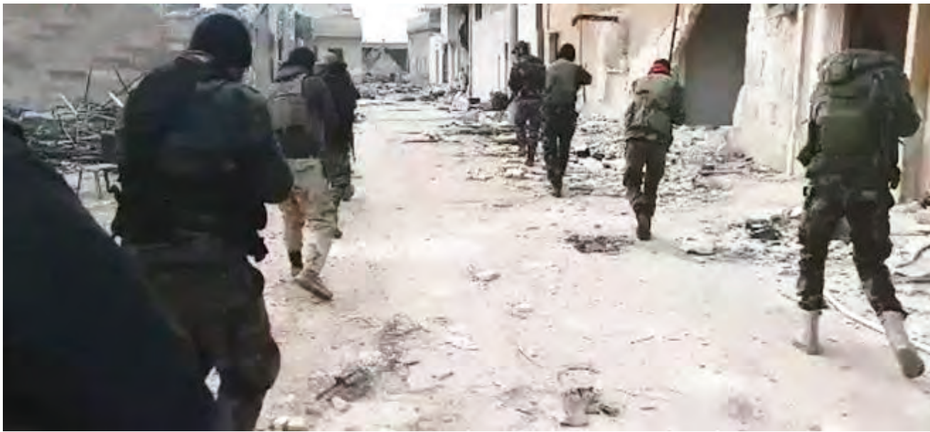
من تمشيط الجيش لأحياء المحررة في معرة النعمان

دعا الجانب التركي لتطبيق تفاهات «خفض التصعيد» لافراف؛ الإرهابيون في إدلب يصعدون اعتداءاتهم والقضاء عليهم ضرورة