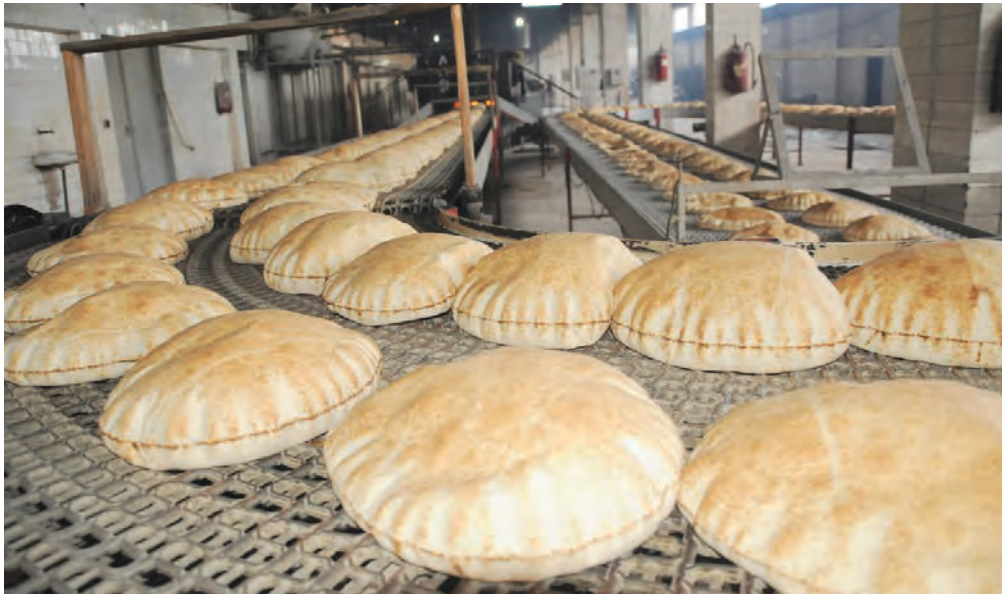
خلال أوقات الدوام الرسمي وإجراء مطابقة بين فرع السورية للحبوب ودائرة المواد بمديرية التجارة الداخلية وحماية المستهلك بشكل شهري وموافاة الوزارة بنتاج المطابقة