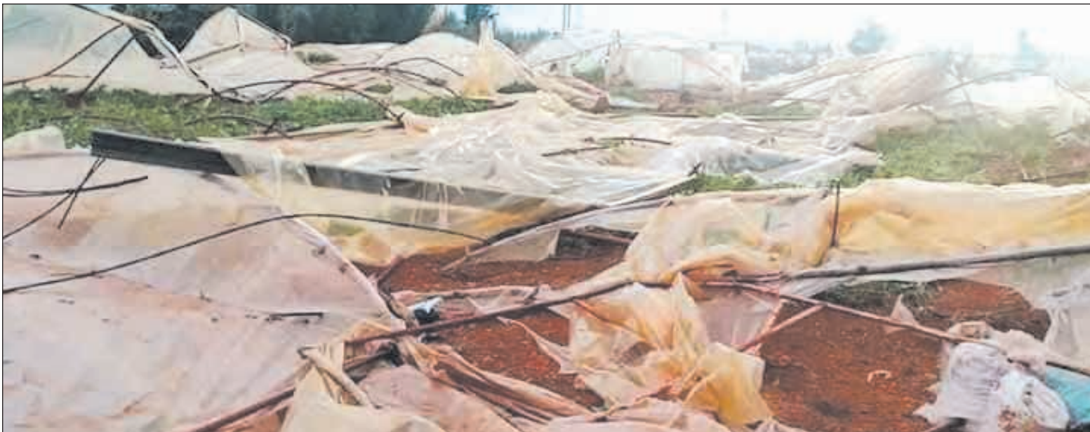
مبنى البيوت البلاستيكية في منطقة طرطوس، حيث يعمل بها آلاف الأسر وعشرات الآلاف من العمال الزراعيين وغير الزراعيين من داخل المحافظة وخارجها، وتعتبر مورد رزقهم الوحيد إضافة لكونها مصدر تنمية للاقتصاد الوطني عبر توفير فرص العمل وتأمين المواد الغذائية على امتداد العام وتصدير الفائض للخارج بالقطر الأجنبي.. الخ.

مديرية الزراعة: نتحرى المواد المهربة.. وننظم ندوات إرشادية