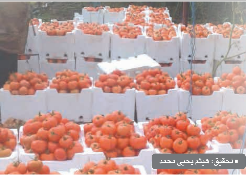
تحقيق: هيثم يحيى محمد

تعتبر الزراعة المحمية من أهم الزراعات في الساحل السوري بشكل عام وفي محافظة طرطوس بشكل خاص حيث يعمل بها آلاف الأسر وعشرات الآلاف من العمال الزراعيين وغير الزراعيين من داخل المحافظة وخارجها، وتعتبر مورد رزقهم الوحيد إضافة لكونها مصدر تنمية للاقتصاد الوطني عبر توفير فرص العمل وتأمين المواد الغذائية على امتداد العام وتصدير الفائض للخارج بالقطر الأجنبي.. الخ. ويبلغ عدد البيوت البلاستيكية في المحافظة نحو ١٣٥ ألف بيت منها في منطقة طرطوس ٨٣٨٢١ بيتاً، وبانياس ٤٣٣٨٩، وصافيتا ٤٣٦١، وفي القدموس ٤٨٨ بيتاً، والدريكيش ٩٧، والشيوخ بدر ٢٧٩ بيتاً ويصل إنتاجها السنوي لنحو ٥٥٠ ألف طن منها (٤٣٠) ألف طن بندورة و (٣٢) ألف طن خيار ثم لقليلة وبانجان وبعض الزراعات الأخرى. هذه الزراعة التي سبق وكتبتنا عنها عدة مرات ستكون محور تحقيقنا لهذا اليوم من الألف إلى الباء بشؤونها وشجونها وصولاً للمقترحات الكفيلة بتطويرها.