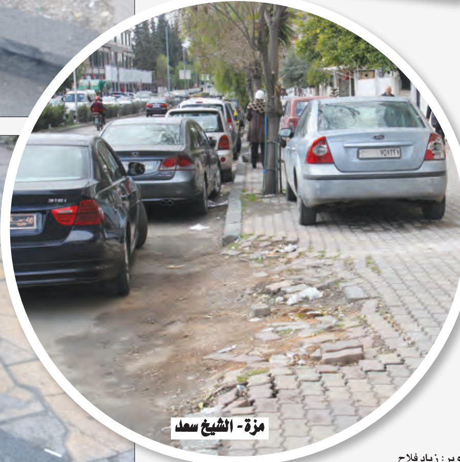
مزة - الشيخ سعد