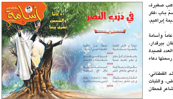
في درب النصر