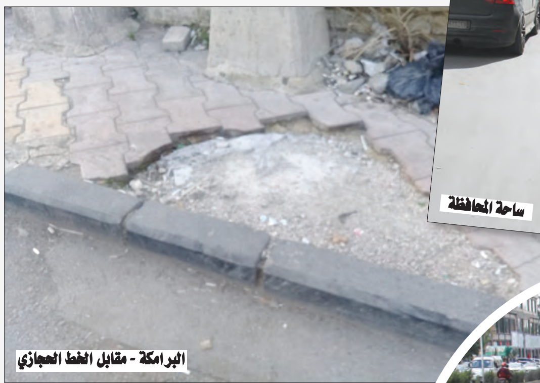
البرامكة - مقابل الخط العجاري