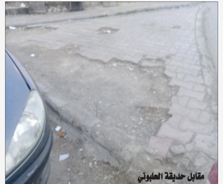
مقابل حديقة العلبوني