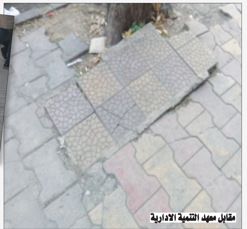
مقابل معهد التنمية الادارية