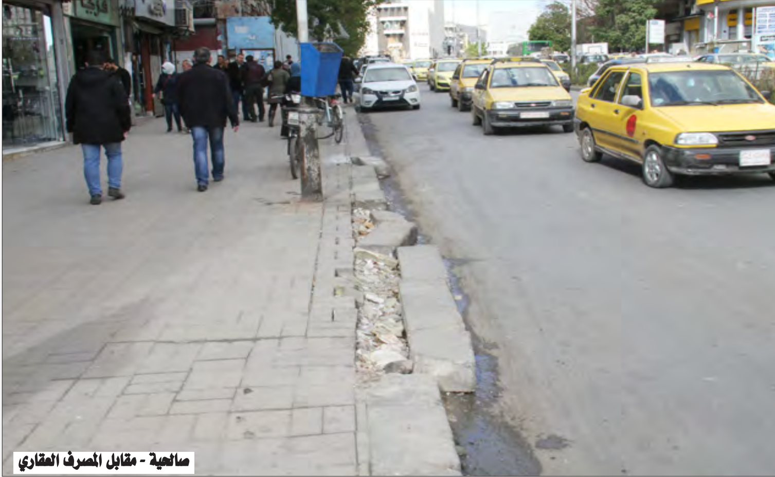
صانحة - مقابل المصرف العقاري

من يتجول في شوارع مدينة دمشق وبعض الأحياء يلمس بوضوح الواقع المؤلم للأطاريف والأرصفة التي طالها الإهمال منذ سنوات مضت، دون إجراء أية صيانة أو تأهيل للكثير منها، وهي اليوم بحاجة إلى الاهتمام بعد التقصير. فهل تبادر مديرية الصيانة في محافظة دمشق برصد واقع هذه الأطاريف والأرصفة، والإسراع على الأقل في عمليات ترقيتها؟ ترك التعليق لباقي الصور الملتقطة بعديسة «الثورة».