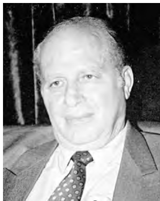
■ بقلم: د. أحمد الحاج علي

تنوع واتساع في توضعاته الإقليمية والجغرافيا، بمواجهة المحتل العثماني وسياسات العار التي ينتهجها، وهذه قصة هي ميزة تتحول مباشرة إلى امتياز في نضال هذا البلد العنيد والقاسي، وما كان للإرهاب المستقطع والنشان ولا للقوى التي أنتجت الإرهاب وما برحت تغذيه بمعدلات فاضحة أن تترك أهمية هذا البعد الوطني الشعبي والتاريخي لسورية العربية. لقد استندت بمجموعة القوى المعادية أفكار وهو جس الشيطان ولاسيما من خلال تقديرات محومة ووقائع مسومة كلها في الأصل خروج عن الوطن وأرادوها خروجاً على الوطن، أي نقل هذه الأفكار الموهومة والتفديرات المزعومة من منطقة الاحتمال إلى مسارات البيع والشراء والمساهمة في اغتيال الوطن بأي مقدار كان هذا الاغتيال وبأي سلاح يستخدم في هذا الاغتيال، وفي الوطن السوري تتوالد الأبعاد من الأبعاد وما يؤهله لعقبيات النصر.