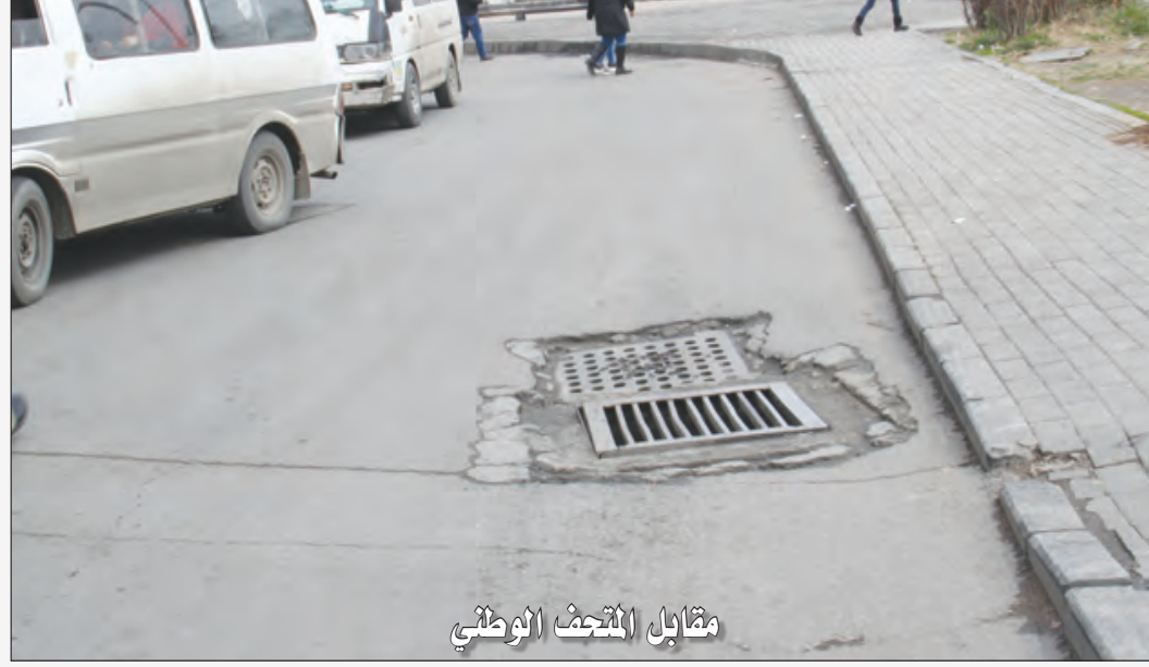
مقابل المتحف الوطني