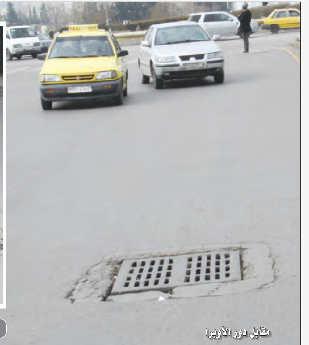
مقابل دور الأوبرا

«الريكرات» في شوارع دمشق لا تسر الخاطر، من بروزها فوق الإسفلت إلى غوصها في أعماقه وكأن الأرض خسفت بها، ربما سوء التنفيذ أو أخطاؤه وربما الإشراف عليها وربما إهمالها نهائياً وعدم إصلاحها وربما كل هذه معاً. ويبدو أن الاعتمادات المرصودة سنوياً في محافظة دمشق لمتابعة الخدمات المتعلقة في صيانتها وإصلاحها لجهة بروزها فوق مستوى الشارع، وأخطاء تحديد منسوب ارتفاعها، تذهب في غير مكانها الصحيح بدليل حالة الترهل في هذا القطاع الخدمي في معظم أنحاء العاصمة.