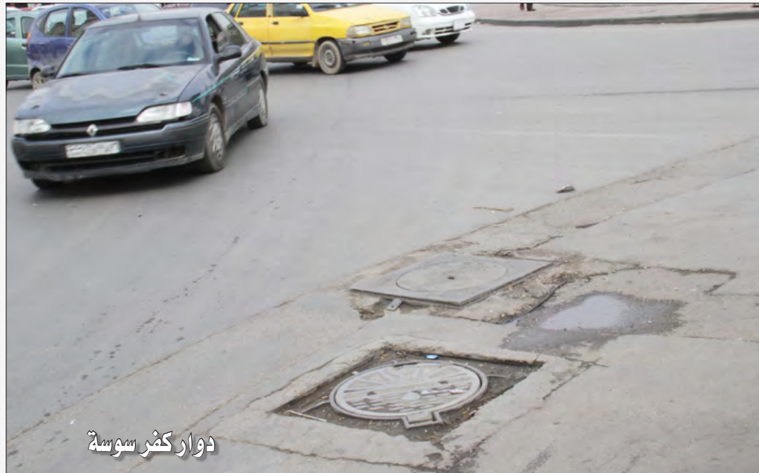
دوار كفر سوسة