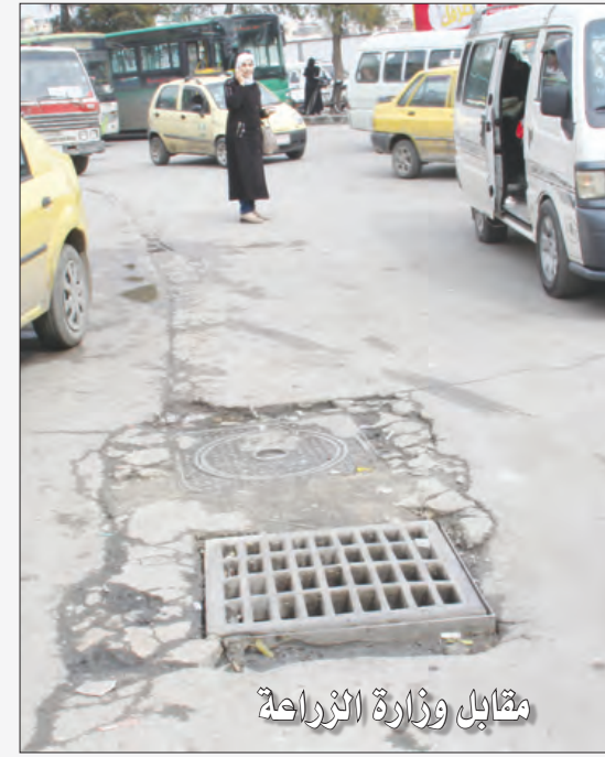
مقابل وزارة الزراعة