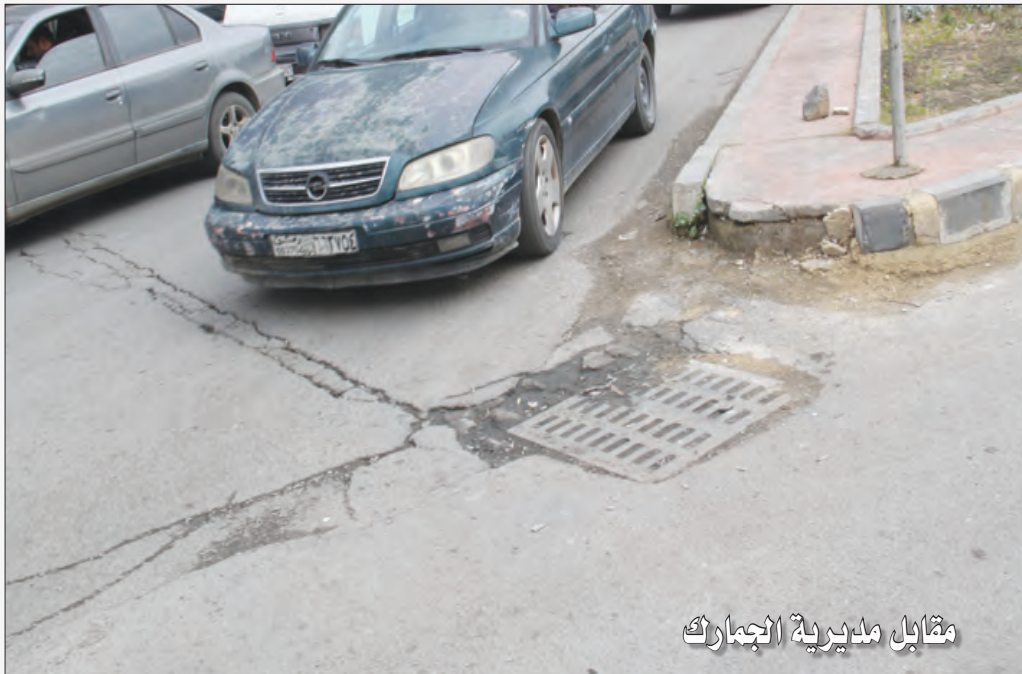
مقابل مديرية الجمارك