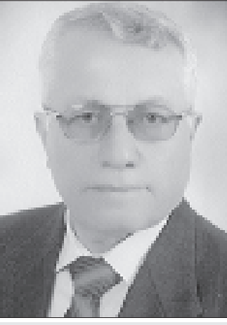
■ بقلم: د. فايز عز الدين

ومن أغرب الحصالات التي كان يواجهها السوريون هي حالة الترحيل والتسويق لمزاعم أنهم يعانون من الظلم، وأن الغرباء أتوا لكي يحرروهم من ريقدهم، ليرى السوريون بعد ذلك كيف شرعت تقطع رؤوسهم بدون ذنب سواء كانوا يرحلون أو يرحلون عنهم الغريب ويؤفهو بغطاء الأسلحة لم يكن موجوداً قبل دخول الأغيار، فالعلم، والصحة، والعمل، والحضارة، والإنسانية، والإنجاز، والتجانب الوطني الذي يعيشتونه في ظل دولتهم الشريفة ذهب مرة واحدة في أيدي الظالمين الظالمين، والتكفيريين التابعين، وما كان يبديه المواطنين وهم تحت نير استبداد أولئك الظالمين