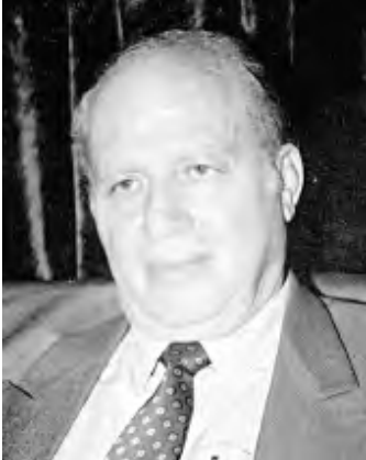
■ بقلم: د. أحمد الحاج علي

إن العدوان العسكري والسياسي والاقتصادي عند أميركا الإمبريالية وعند تركيا العدة للعرب والإسلام وعند الأنظمة السياسية الرجعية، هذه الخاصية متجذرة في هذه المناطق السياسية والاجتماعية حتى وهي مهزومة ومينونة كما في النموذج التركي، إنما تتحين الفرص وتنقض على عدوهم المقتول هو العرب وقضايا العرب ولا يوقف زحف هذه السادية المقيتة في الاعتداء وأن ديني أو اعتبارات إنسانية أو خواطر الجيرة والجوار ولا يحد من شبق القتل عند هؤلاء، عهد