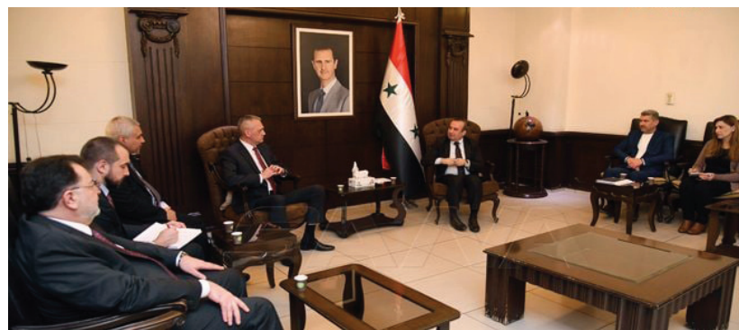
طهران: نواجه / بقية /

وأكد مخلوف أهمية التعاون المشترك بين البلدين لتأمين احتياجات وزارة الإدارة المحلية والمحافظات والجهات التابعة لها من الآليات الهندسية والجرارات، وأهمية تفعيل الاتفاقيات السابقة المتعلقة بتقديم باصات النقل الداخلي لسورية. من جانبه السفير البيلاروسي أكد أهمية علاقات التعاون بين البلدين في مختلف المجالات، مشيراً إلى ضرورة تقديم الاحتياجات الإنسانية للشعب السوري.