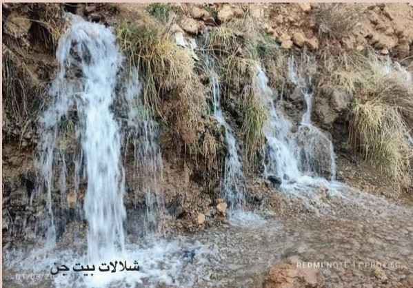
شلالات بيت جن

شلالات المياه العذبة الرقراقة تدفقت من تلال بيت جن بمحافظة القنيطرة.. على حين تهادى نهر بردى والتقى بنبع الفيجة بريف دمشق، ليسقي كل ما حوله ويروي معشوقته الأزلية دمشق.. بينما جرى نهر الدلبة في ريف طرطوس من النبع إلى البحيرة ليشكل متنزهاً طبيعياً رائع الجمال، حيث تنتشر أشجار الدلب والصفصاف، إضافة للسنديان والغار.