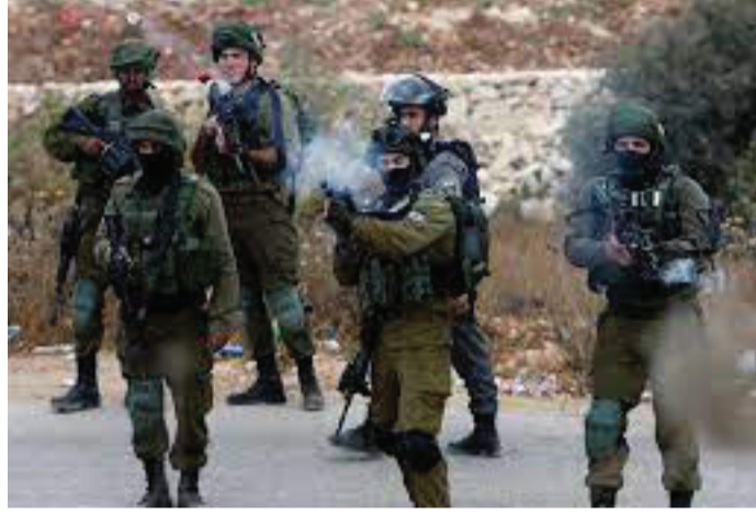
إصابات بالاختناق بين الطلبة.

في سياق منفصل، واصلت قوات الاحتلال الإسرائيلي، إغلاق جميع مداخل مدينة أريحا الرئيسية والفرعية، بحواجزها العسكرية، لليوم التاسع.