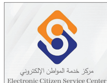
مركز خدمة المواطن الإلكتروني Electronic Citizen Service Center

/٣٣٩,٨٩٩/ معاملة أصدرها المركز الرئيسي بدمشق، و/٢٢٤,٢٥١/ معاملة في حلب، و/١٥٧,٠٦٦/ معاملة بريف دمشق، و/١٣٣,٢١٧/ معاملة إلكترونية في إلب.