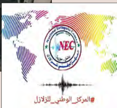
#المركز الوطني للزلازل

نريد إقامة منشأة يجب أن تكون لدينا دراسة زلزالية عن التراكيب الجيولوجية كي لا نبني منشآت على فوالق وتراكيب غير مستقرة، مشيراً إلى أن البيانات ضرورية أيضاً لمعرفة طبيعة الأرض وبالتالي تحديد مواصفة البناء ومدى مقاومته للزلازل، كما يمكن أن تشكل مورداً مادياً عبر بيعها أو تبادلها مع الدول والشركات، باعتبار أنه لا أحد يقيم استثمارات كبيرة دون أن يكون لديه دراسة