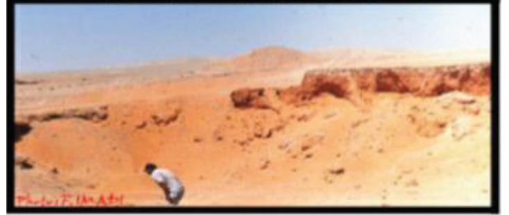
موقع انتشار الرمال الكوارتزية في منطقة الثنايا

الرمال الكوارتزية في موقع الحمايراه (سد القريتين)