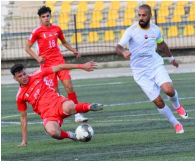
لأصحاب الأرض المتطلعين للتقدم وبخول دائرة المنافسة من جديد.

ويتطلع صاحب الضيافة وهو الصعب على أرضه إلى الفوز لتقليص الفارق مع الفتوة المتصدر، على أمل الاقتراب والضغط عليه، وخاصة إذا ما خسر مباراته أمام الجيش التي لن تكون سهلة. بالمقابل سيحاول الوحدة الذي يلعب تحت الضغط تحقيق أفضل نتيجة لاستعادة الثقة، والتعادل يرضيه غداً نظراً للظروف التي يلعب فيها.