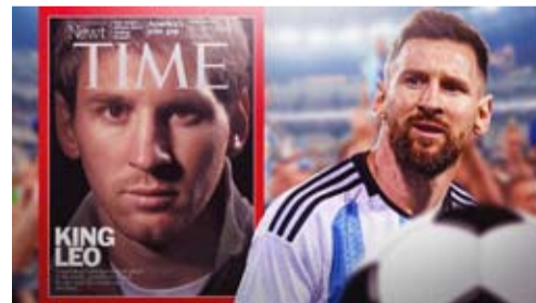
■ ريم عبدو

حصل النجم الأرجنتيني ليونيل ميسي على جائزة رياضي العام من مجلة تايم الأميركية، لتأثيره على كرة القدم الأمريكية منذ انضمامه إلى إنتر ميامي هذا الصيف. وكتبت المجلة: لقد حقق ميسي ما بدا مستحيلًا، جعل الولايات المتحدة دولة لكرة القدم. وغادر ميسي الذي فاز بجائزة الكرة الذهبية في نهاية تشرين الأول الماضي للمرة الثامنة في مسيرته، باريس سان جيرمان في تموز الماضي لينضم إلى إنتر ميامي، النادي الذي يشترك في ملكيته النجم الإنكليزي السابق ديفيد بيكهام، بعد سبعة أشهر من فوزه بلقب بطل العالم ٢٠٢٢ مع الأرجنتين. وقال ميسي: كان خياري الأول هو العودة إلى برشلونة، لكن ذلك لم يكن ممكناً. وصحيح أيضاً أنني فكرت حينها في الانتقال إلى الدوري السعودي، وهو دوري قوي يمكن أن يصبح مهماً في المستقبل في بلد أعرّفه.