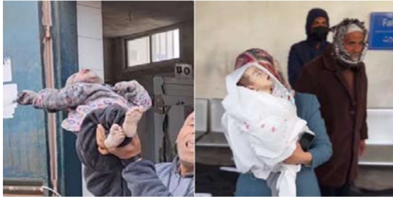
الفلسطينية جنوب قطاع غزة.

وبينت الوزارة أن مياه الصرف الصحي تغمر قسم الطوارئ وتعيق عمل الطواقم في المجمع وسط خشية امتدادها إلى أقسام الأشعة، مطالبة المجتمع الدولي بالضغط على الاحتلال لحماية الطاقم الفني للتحرك في ساحات المجمع لإصلاح شبكة الصرف الصحي.