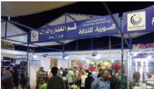
البيع بسيارات المؤسسة.

ولفت إلى أنه إضافة لما ذكر ثمة عمل نحو تذليل المعوقات، مثل