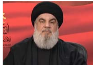
الكيان إخفاء خسائره البشرية والمادية سواء ■ البقية ص «٢»

نصر الله: جبهتنا في لبنان لن تتوقف ما دام العدوان مستمراً على غزة