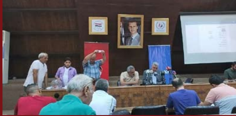
الشعبية الأولى على تنفيذه خلال فترة ولايته تحت قبة الفيحاء. وترتكز إيجابية ردود الفعل على إمكانية إلزام الأندية بالاهتمام أكثر بالعمل

ولن تكون الأمور وريدية بالصورة التي يتخيلها البعض لأن جاهزية الملاعب ووفرته تبقى محل شك، لناحية قدرتها على استقبال مباريات مسابقات الدوري المنتظر لمختلف الفئات.