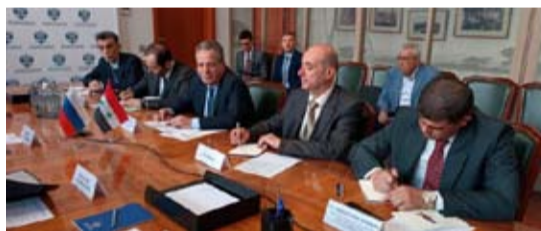
تنفيذاً لتوجيهات الرئيسين بشار الأسد وفلاديمير بوتين.

أكد وزير النفط والثروة المعدنية في حكومة تسيير الأعمال الدكتور فراس قدور عمق وأهمية علاقات التعاون بين سورية وروسيا الاتحادية، وبصورة خاصة في مجال الطاقة بكل قطاعاتها. وأعرب الوزير