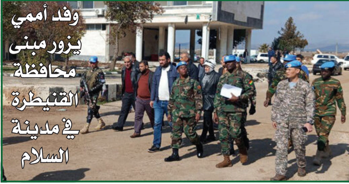
وفد أممي يزور مبنى محافظة القنيطرة في مدينة السلام