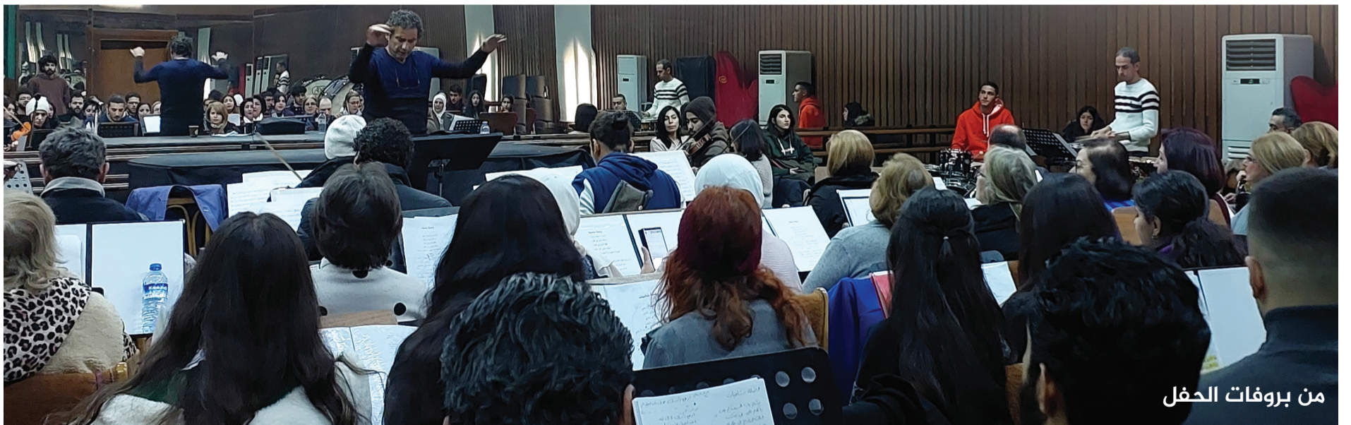
من بروفات الحفل